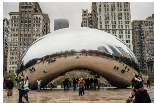
The Cloud Gate

Déjeuner à votre hôtel. En matinée visite de la ville avec un guide local en français. Ce tour mettra en vedette l'architecture de plusieurs édifices de la ville. Vous verrez les emplacements historiques liés à l'histoire de la ville, d' Al Capone , les incorruptibles , la musique et Barack Obama . Dîner libre. Visite à pied du parc Millenium où vous verrez The Bean , de son vrai nom The Cloud Gate une sculpture urbaine de l'artiste britannique Anish Kapoor . Le parc se présente comme une galerie d'art à ciel ouvert; visite libre du Art Institute of Chicago . Retour à l'hôtel en se promenant sur l' avenue Michigan qui traverse la rivière Chicago (environ 1.7 km). Souper et soirée libre. (Dé)